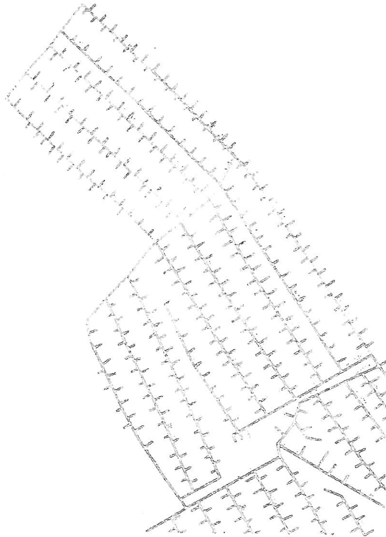
Схема распределительного газопровода в квартале № 1